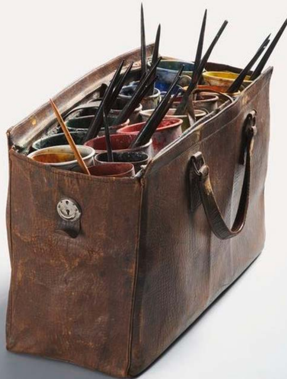
Emil Nolde, Malertasche mit Pinseln